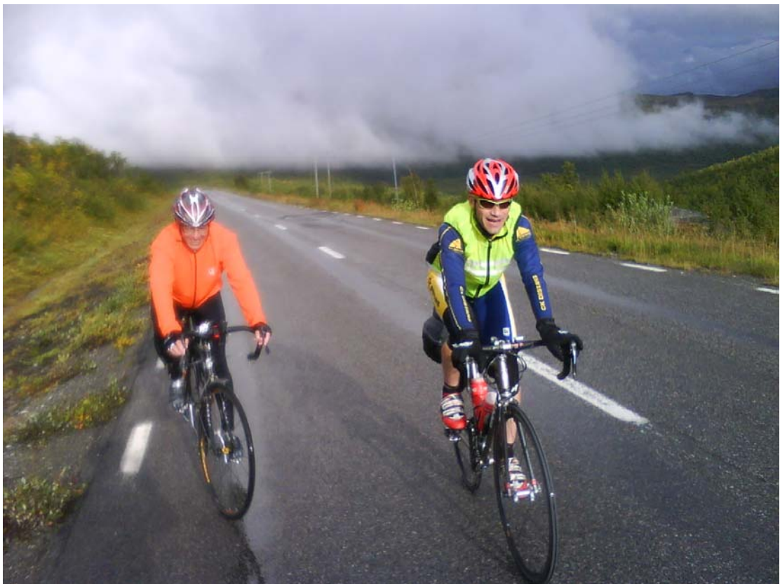
The only way is up.