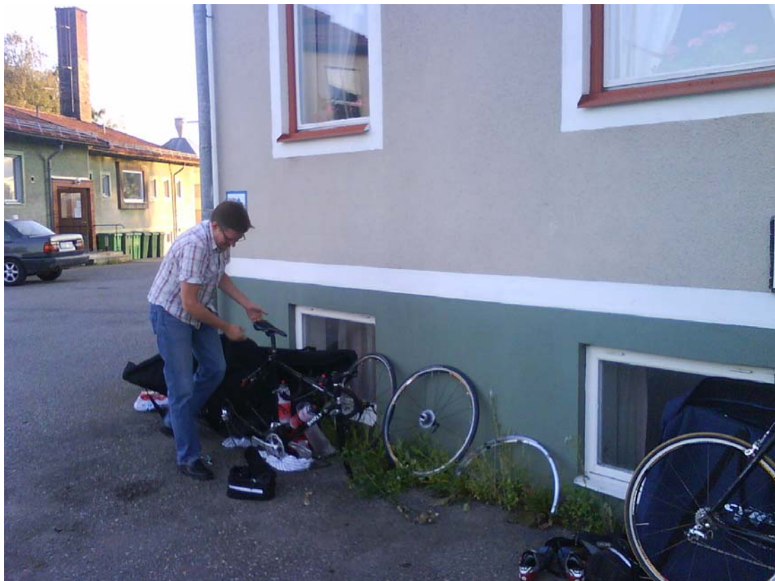
Cykellogistik vid vandrarhemmet i Tullingsås.