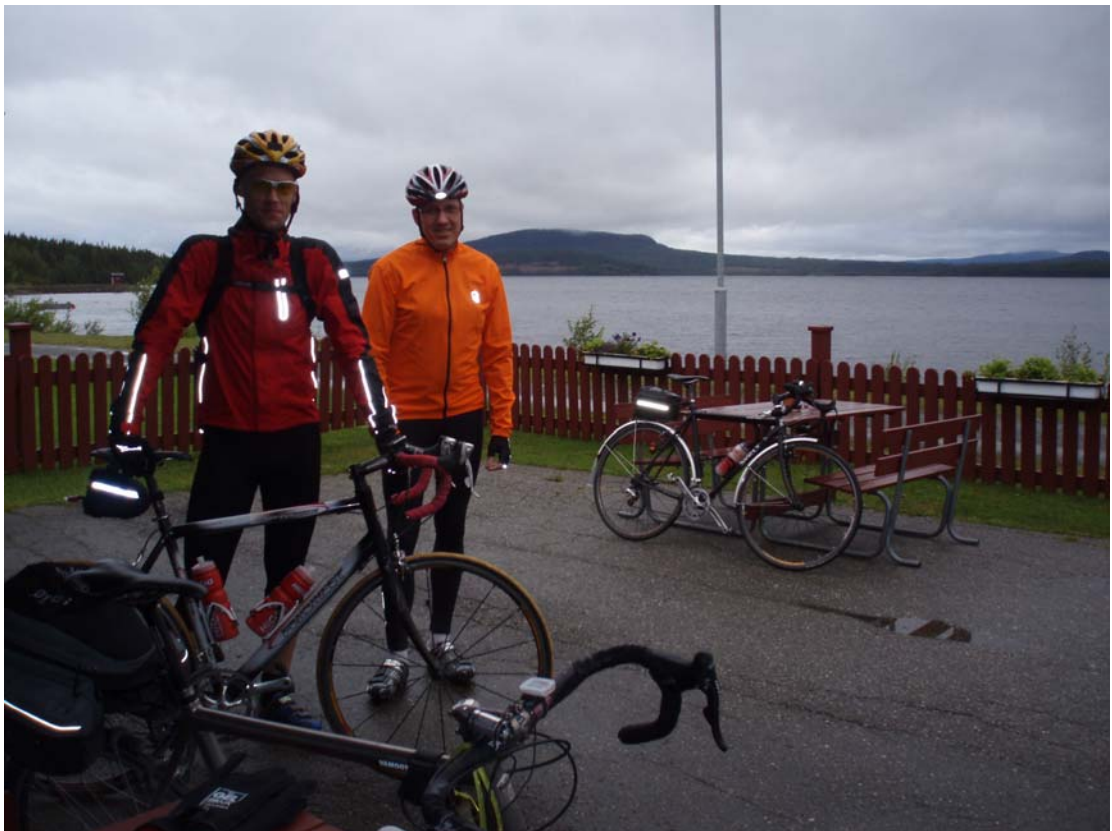
Gäddede, inför start, dag 2.