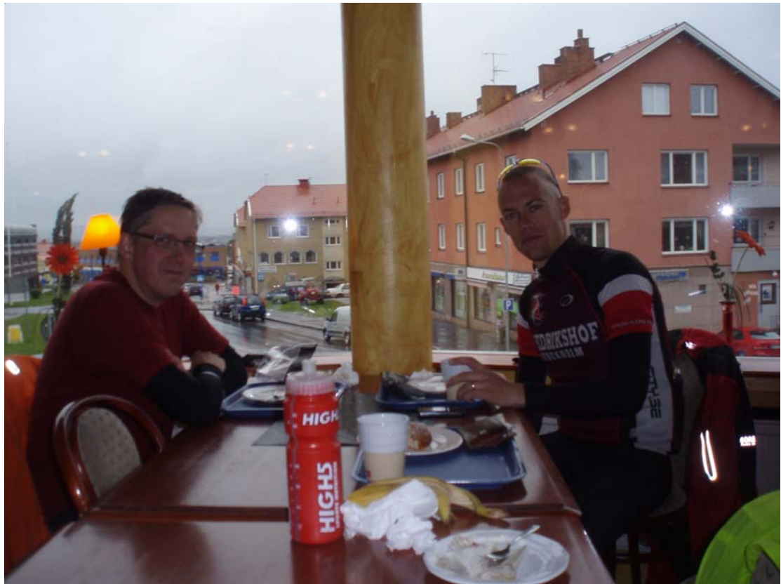
Fikastopp i Vilhelmina.